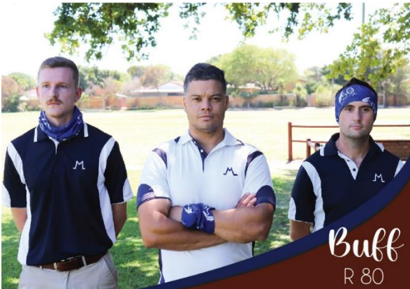
Buff R 80

KONTANT: Stuur die korrekte bedrag in 'n gemerkte koevert + strokie