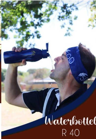
Waterbottel R 40