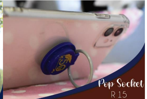
Pop Socket R 15