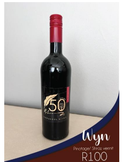
Wyn Pinotage/ Shiraz versnit R100